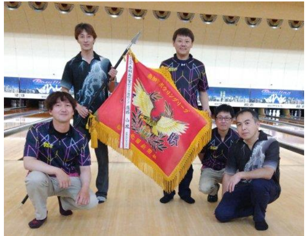
優勝 中田建設工業