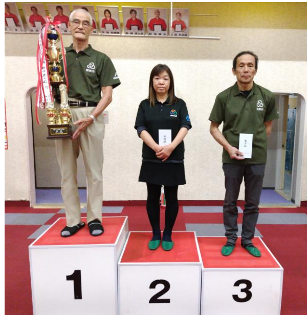
能美市会長杯 上位入賞者